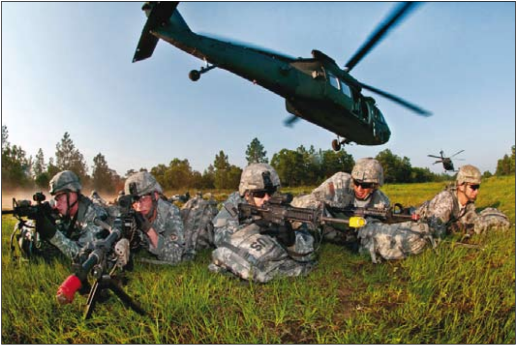
Trupp ur 82nd Airborne Division, ett av de amerikanska förbanden med expeditionär förmåga.

att det en dag uppstår strategiska överraskningar.