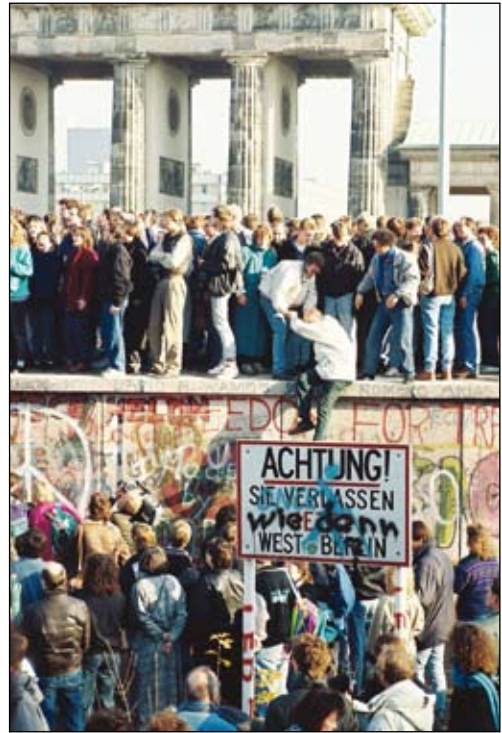
Stormingen av muren 9 november 1989.

Sovjetunionens upplösning 1991 kan ses som en följdruptur av den malström som tidigare lett till murens fall.