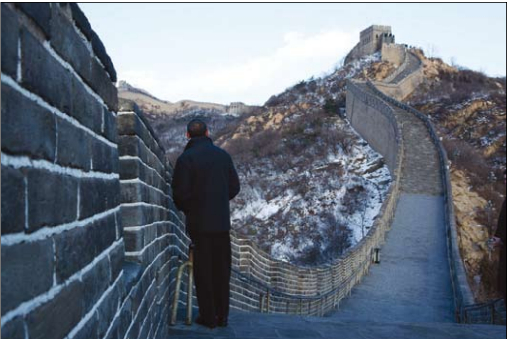
President Obama på symbolen för Kinas problem med grannländer. USA har också en roll i maktspelet

Relationen mellan USA och Kina präglas av ambivalens. Å ena sidan råder betydande rivalitet mellan de båda makterna. Å