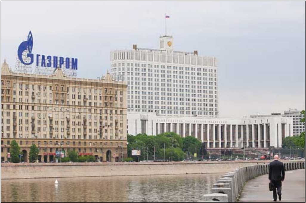
Makten och dess instrument. Hur länge håller modellen?

nera på en utveckling av Shtokmanfältet i Barents hav på hyllan – den tänkta produktionen av gas var avsedd för en amerikansk marknad som helt enkelt inte finns längre. Det kraftigt minskade amerikanska importbehovet har vidare inneburit att betydande mängder flytande naturgas (LNG) som varit avsedd för export till USA bl a från Qatar har frigjorts och kommit marknaden till del. Därmed har utbudet ökat och kraven på en mer flexibel gasmarknad artikulerats tydligare. Marknadens aktörer vill inte längre gå med på att ingå de långsiktiga kontrakt med bundna priser och kvantiteter som länge varit normen.