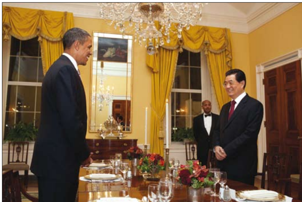
Mycket att avhandla. Presidenterna Barack Obama och Hu Jintao inleder arbetsmiddag i Vita huset 18 januari 2011.

främsta katalysator med djup påverkan också på andra viktiga förhållanden som inte brukar hänföras till den ekonomiska sfären. Globaliseringen med sina flöden av varor, pengar och information har lett till en internationell arbetsfördelning som kopplar samman det lokala med det globala. Föreställningar om att utvecklingen måste fortsätta i ett linjärt spår, måste dock starkt ifrågasättas. Globalisering är inte ett nytt fenomen; världsekonomin var mer integrerad under slutet av 1800-talet än på 1990-talet – först då nådde kapitalflödena relativt världsekonomin storlek den nivå de haft före första världskriget. Det kan vara värt att begrunda att den integrerade ekonomin då ofta sades omöjliggöra krig. Likväl bröt första världskriget ut.