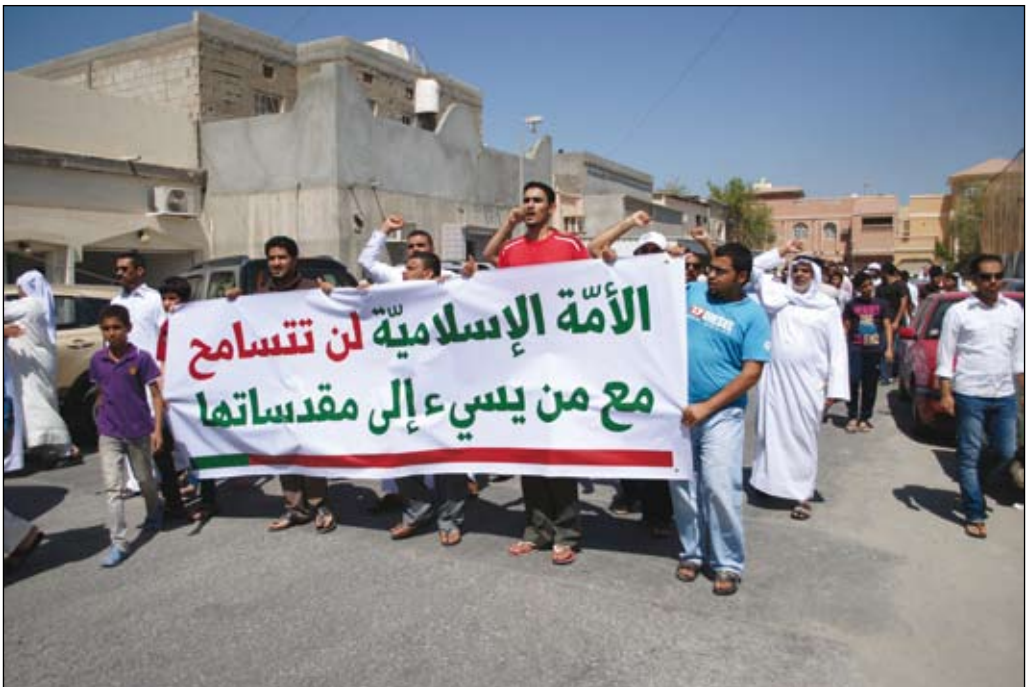
Demonstration mot filmen "Innocence of Muslims".

I västvärlden har globaliseringen inneburit standardhöjning i form av billigare varor men även att många ”halvkvalificerade” arbeten exporterats eller automatiserats. Traditionellt utgör de som haft sådana arbeten en stor del av den samhällsbärande medelklassen i i-världen. Resultatet är att högutbildade och kreativa får det allt bättre medan en allt större andel av den tidigare medelklassen halkar efter med sociala och politiska spänningar som följd.