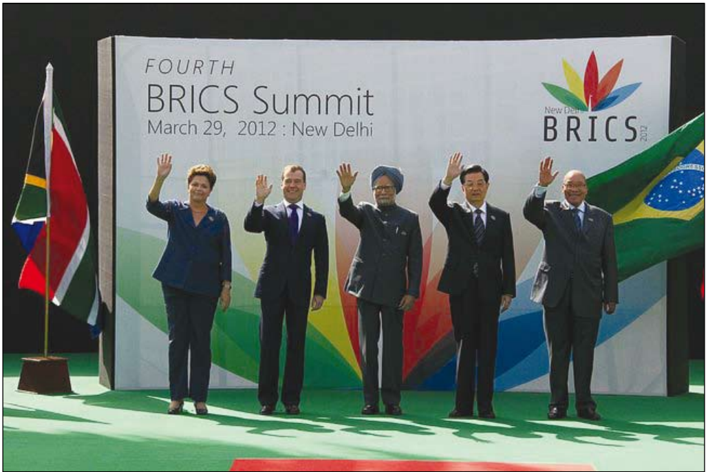
BRICS-toppmötet 29 mars 2012