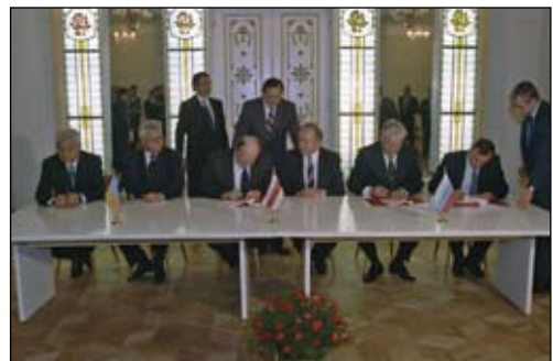
Dokumentet som innebär Sovjetunionens upplösning undertecknas 8 december av Leonid Kravtjuk, Ukraina (2 fr v), Stanislav Sjusjkevitj, Belarus (3 fr v) och Boris Jeltsin, Ryssland (2 fr h)