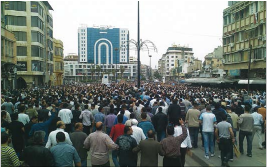
Arabisk vår som dröjer: De folkliga protesterna mot Assad-regimen i Syrien – här i Homs 18 april 2011 – kvävs nu i blod.

Iran är en maktfaktor i arabvärlden bl a genom sitt inflytande över Irak, Syrien och Hizbollah i Libanon. Därtill bidrar landets befarade ambitioner att utveckla kärnvapen till att öka spänningen i området.