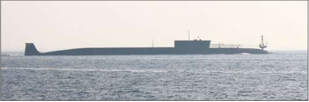
Jurij Dolgorukij, den första ubåten i Borej-klassen som skall ersätta Delta- och Typhoonklasserna i Rysslands strategiska kärnvapenarsenal.

på senare tid alltmer ansträngda relationerna mellan USA och Ryssland kommer att bestå under Putin.