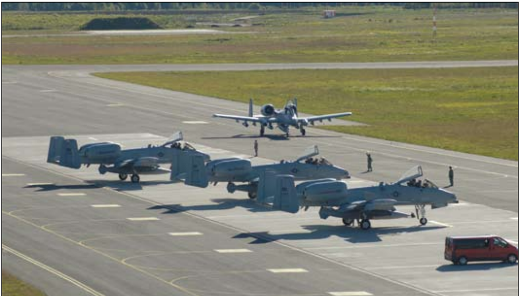
Från NATO-övningen Saber Strike i Estland och Lettland sommaren 2012. A-10 Thunderbolt från Michigan Air National Guard på Amari-basen i Estland. Ett tillräckligt sätt att göra NATO:s säkerhetsgaranti trovärdig?

Vi kan skönja en betydelsefull strategisk vindkantring, eller kanske snarare vindkantringar, vars konsekvenser vi inte kan förutse. Det finns därför goda skäl att tro