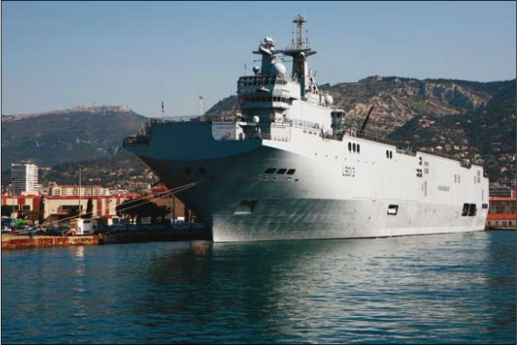
Franska amfibiefartyget Mistral i Toulons hamn. Ryssland har beställt två fartyg med option på ytterligare två. Fartyget kan transportera exempelvis en pansarbataljon.

förhållanden och bidrar till att göra regionen mer åtkomlig. Klimatförändringen är den främsta drivkraften mot ett nytt Arktis.