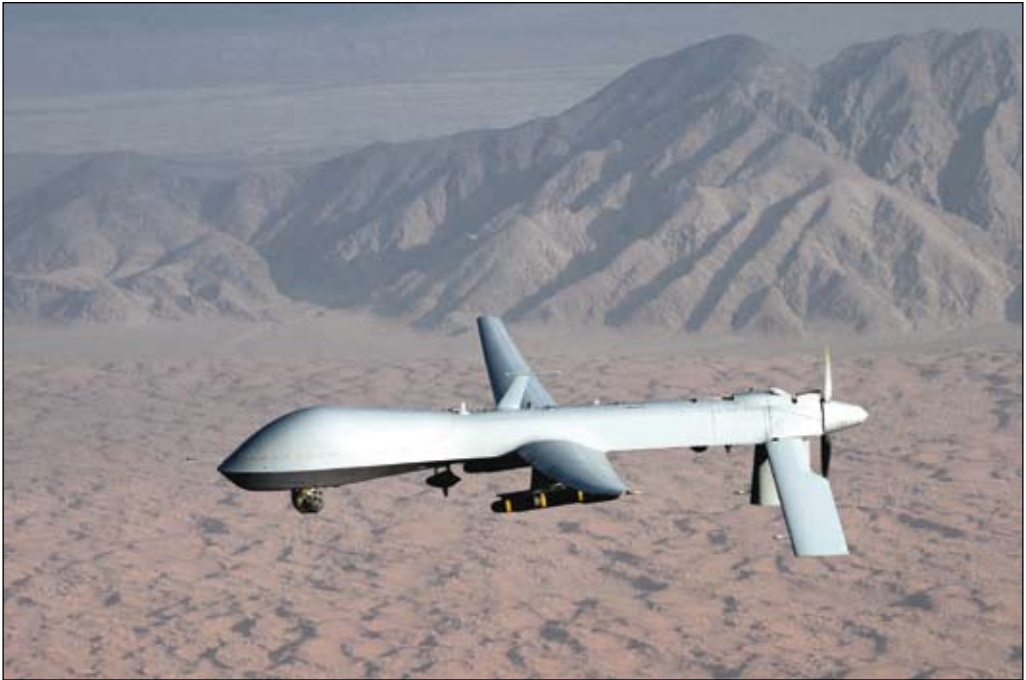
UAV:n RQ-1/MQ-1 Predator är 8 m lång, har vingbredd 15 m och kan medföra 500 kg vapenlast. Dess användning mot talibaner på pakistanskt område har försämrat relationerna med Pakistan.

flikter samt tilltagande etniskt och politiskt våld.