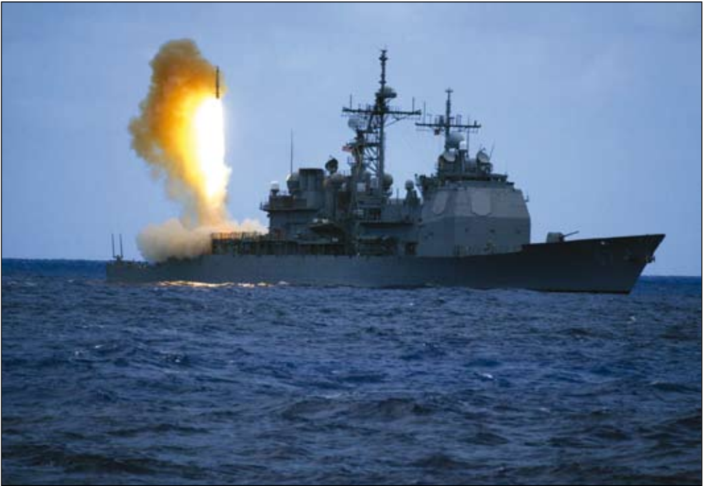
Prov med SM-3-missilen från kryssare av Ticonderoga-klass 2006. Missilen ingår i Aegis Ballistic Missile Defense System som av president Obama deployerades till Europa som en interimslösning i avvaktan på en lösning av de politiska motsättningarna med Ryssland om missilförsvaret.

Osäkerheten rörande den framtida amerikanska strategin, i kombination med Rysslands modernisering av sitt försvar, har manifesterats i en ökande bilateral spänning inom rustningskontrollfältet – allra främst rörande missilförvarsfrågorna och därmed sammanhängande strategiska förändringar. USA:s och Natos planer på ett integrerat missilförvarssystem täckande Europa med omgivning, särskilt i sydöst, uppfattas av Ryssland som ett hot mot dess strategiska kärnvapenförmåga, d v s dess vitala säkerhet.