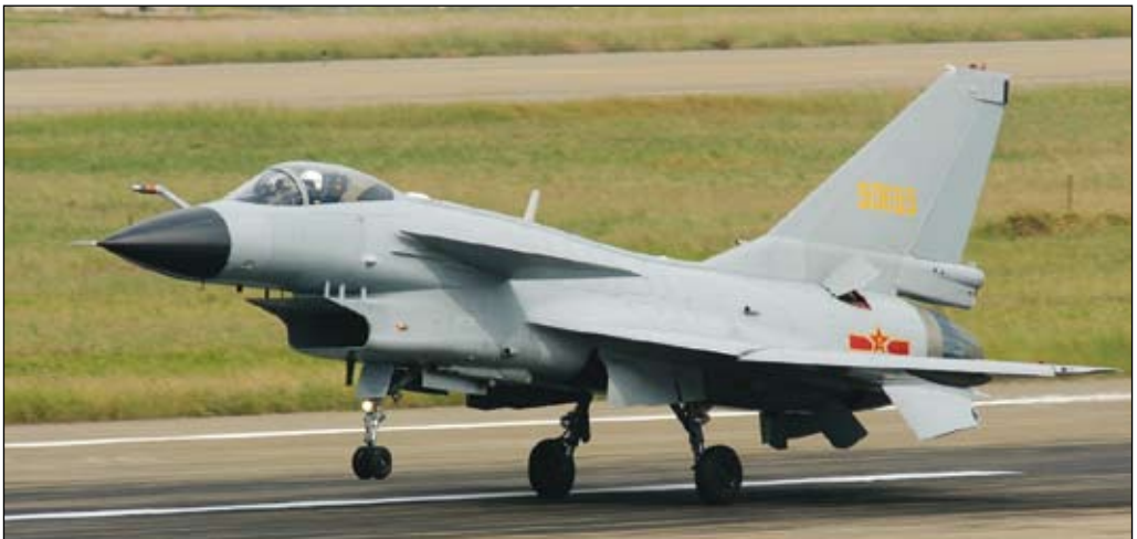
Överst: Kinesiska jagaren Haribing på flottbesök i San Diego. I mitten: Kinas nyaste strategiska robotubåt (SSBN) Jin-klassen. Nederst: Chengdu J-10 Multirole fighter. I tjänst år 2005. 210 st hade producerats år 2011. Kina har världens till storleken tredje flygvapen.