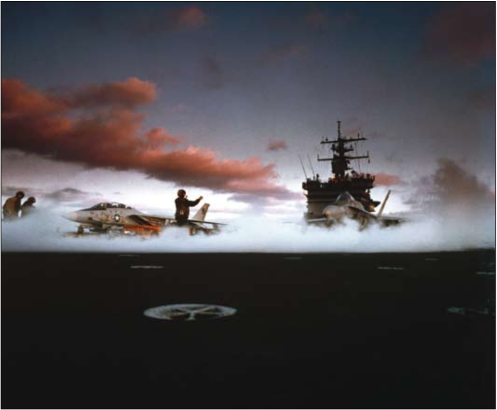
En F-14 Tomcat och en F/A-18 Hornet förbereds för start från USS Enterprise. USA betonar alltmer sin dominerande roll till sjöss och i luften.

förmåga. Centralt för Sverige blir hur detta tolkas i Moskva.