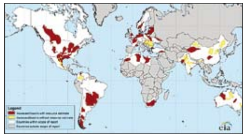
Världens skiffergasreserver.

En av de mest betydelsefulla förändringarna är den kraftigt ökade självförsörjning ifråga om energi som USA uppnått de senaste åren med utvinningen av okonventionella fossila bränslen, främst den skiffergasen. 4 Denna viktiga och relativt snabbt uppkomna förvandling, med ett USA som lär bli självförsörjande på energiområdet, sannolikt till nettoexportör, är en ruptur med potentiellt genomgripande konsekvenser. En fråga som diskuteras livligt är i vad mån den ökande självförsörjningsgraden kommer att påverka amerikansk säkerhetspolitik.